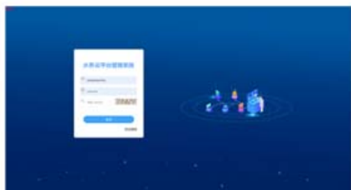
水务云客户管理系统