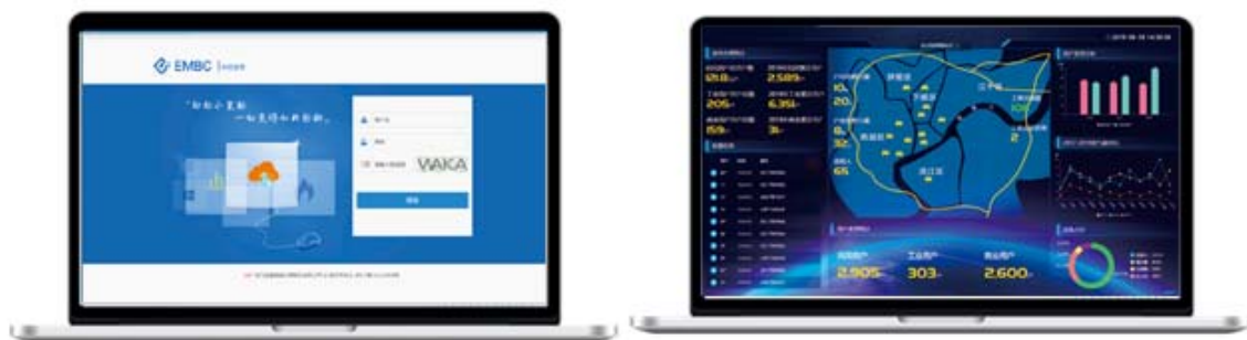
燃气云客户管理系统