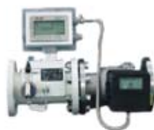
工业智能燃气流量计（控制器）