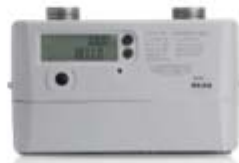
商业超声波燃气表