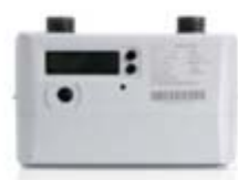
民用超声波燃气表

超声波计量仪表是利用超声波在介质中传递的时间差进行计量的新型计量仪表，它是一种高可靠性、高精度、带温压补偿的全电子式仪表。公司充分运用超声波计量技术精度高、易于实现智能化等特点，向运营商提供全电子一体化的先进计量解决方案，满足运营商对计量终端设备长期保持计量准确度的要求，凭借实时温度补偿、耐低温、宽量程等技术优势，改善运营商供销差问题，全面解决日常计量、用气安全监测、漏损监测等需要。