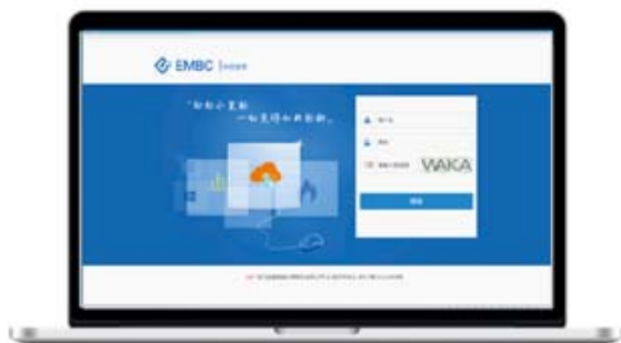
燃气云客户管理系统