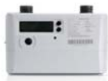
民用超声波燃气表

超声波计量仪表是利用超声波在介质中传递的时间差进行计量的新型计量仪表，它是一种高可靠性、高精度、带温压补偿的全电子式仪表。公司充分运用超声波计量技术精度高、易于实现智能化等特点，向运营商提供全电子一体化的先进计量解决方案，满足运营商对计量终端设备长期保持计量准确度的要求，凭借实时温度补偿、耐低温、宽量程等技术优势，改善运营商供销差问题，全面解决日常计量、用气安全监测、漏损监测等需要。