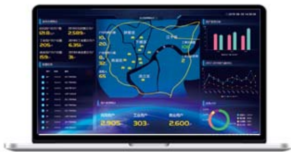
燃气云客户管理系统